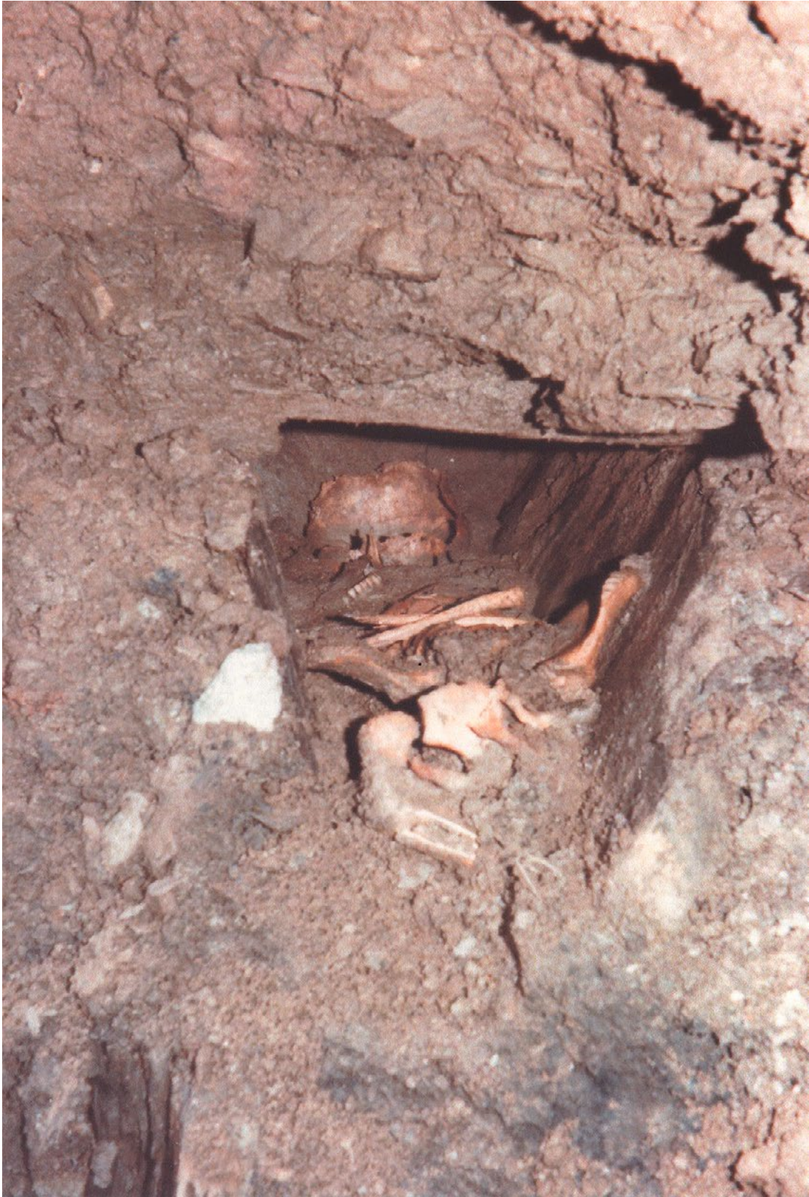
Figure 2. Vue de détail de la sépulture I recoupée par les travaux fin mars 1982.