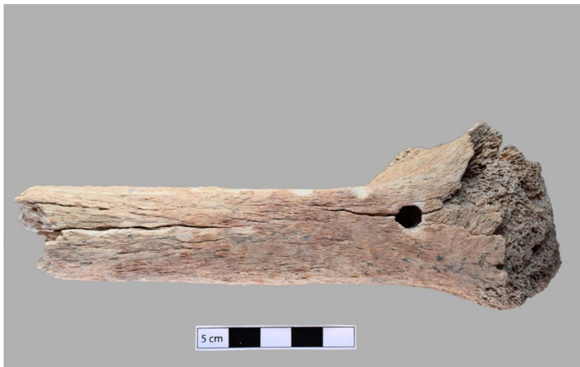
Figure 4. Tiers proximal de diaphyse de fémur gauche conservé et daté par radiocarbone (vue de la face antérieure).